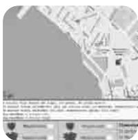
Μια Εφαρμοσμένη Πληροφορική.

Το 1ο βραβείο με έπαθλο 6.000 ευρώ, απονεμήθηκε στο Eco Truck, μια διαδικτυακή εφαρμογή για τη βελτίωση της διαδικασίας συλλογής χαρτιού προς ανακύκλωση. Συμμετέχοντες: Κατερίνα Σιδηροπούλου και Νικόλαος Μπεζιργιάννης από το Πανεπιστήμιο Μακεδονίας Οικονομικών και Κοινωνικών Επιστημών, Τμήμα Εφαρμοσμένης Πληροφορικής.