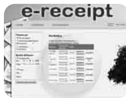
Τμήμα Ηλεκτρολόγων Μηχανικών και Μηχανικών Υπολογιστών και Βαλεντίνος Ευριπίδου, Οικονομικό Πανεπιστήμιο Αθηνών, Τμήμα Πληροφορικής.

Το 2ο βραβείο, συνοδευόμενο από 4.000 ευρώ, απέσπασε το e-Receipt, ένα σύστημα έκδοσης ηλεκτρονικών αποδείξεων και λογαριασμών που καταργεί την εκτύπωση, με στόχο τη μείωση κατανάλωσης χαρτιού. Συμμετέχοντες: Κυριάκος Τούμπας, Εθνικό Μετσόβιο Πολυτεχνείο, Τμήμα Ηλεκτρολόγων Μηχανικών και Μηχανικών Υπολογιστών και Βαλεντίνος Ευριπίδου, Οικονομικό Πανεπιστήμιο Αθηνών, Τμήμα Πληροφορικής.