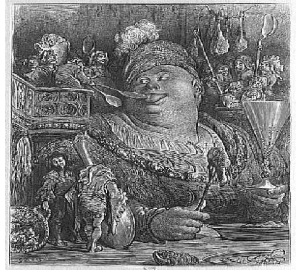
Gustave Doré, illustration from "Gargantua et Pantagruel" by François Rabelais