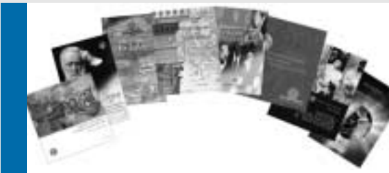
Πολλά από τα πρακτικά των κύκλων ομιλιών του προγράμματος "Επιστήμης Κοινωνία" εκδίδονται σε βιβλία.

Παράλληλα, το ΕΙΕ έχει αναπτύξει σημαντικές δράσεις για την εκπαίδευση της επιστήμης στο πλαίσιο των ειδικών μορφωτικών εκδηλώσεων με τίτλο "Επιστήμης Κοινωνία". Στόχος είναι η προβολή των επιστημονικών επιτευγμάτων στο ευρύ κοινό και η ανάδειξη του κοινωνικού χαρακτήρα της έρευνας. Μέχρι σήμερα έχουν διοργανωθεί περισσότεροι από 100 κύκλοι ομιλιών στους οποίους συμμετείχαν 700 περίπου ομιλητές.