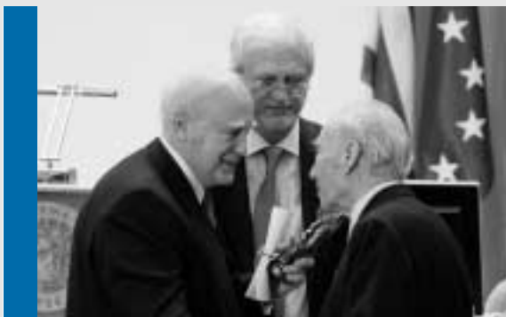
Ο Πρόεδρος της Δημοκρατίας Κ. Παπούλιος απονέμει το βραβείο "Επιστήμης Αριστείων" στον Ακαδημαϊκό Μιχάλη Σακελλάριου.

χρονο και σοβαρό ερευνητικό κέντρο". Υποστηρικτές της πρωτοβουλίας ήταν ο Λεωνίδας Ζέρβας, καθηγητής Οργανικής Χημείας του Πανεπιστημίου Αθηνών και ερευνητής στις ΗΠΑ, και ο Κ. Θ. Δημαράς, ιστορικός των νεοελληνικών γραμμάτων και Γενικός Διευθυντής του Ιδρύματος Κρατικών Υποτροφιών, οι οποίοι συνεργάστηκαν για τη διαμόρφωση του καταστατικού του ΒΙΕ και το σχεδιασμό του οργανωτικού σχήματος και των δράσεων του νέου οργανισμού.