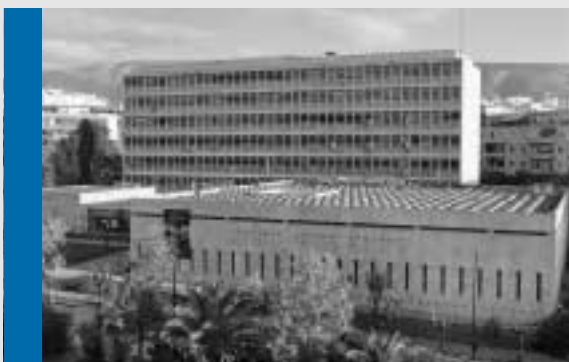
Το κτίριο του ΕΙΕ κτίστηκε το 1968 με σχέδια του πολεοδόμου Κ. Δοξιάδη και του αρχιτέκτονα καθηγητή Δ. Πικιώνη. Θεωρείται ένα από τα καλύτερα κτήρια του Μοντέρνου Κινήματος της Αθήνας και αποτελεί μία από τις πεισικότερες εφαρμογές της νεωτερικότητας που ήθελε τη μορφή να ακολουθεί τη λειτουργία. Συγκρατείται στα αντιπροσωπευτικότερα πρότυπα της διεθνούς αρχιτεκτονικής της μεταπολεμικής περιόδου στη χώρα μας.

Το 1960 ιδρύθηκαν τα Κέντρα Βυζαντινών και Νεοελληνικών Ερευνών και το 1968 το Κέντρο Φυσικοχημείας. Τα επιτεύγματα της πρώτης δεκαετίας 1958-68 ήταν εντυπωσιακά: χρηματοδότηση από εθνικούς και διεθνείς πόρους (Κυβέρνηση των ΗΠΑ, Ίδρυμα Ford, NATO), 67 εκατομμύρια δρχ. για