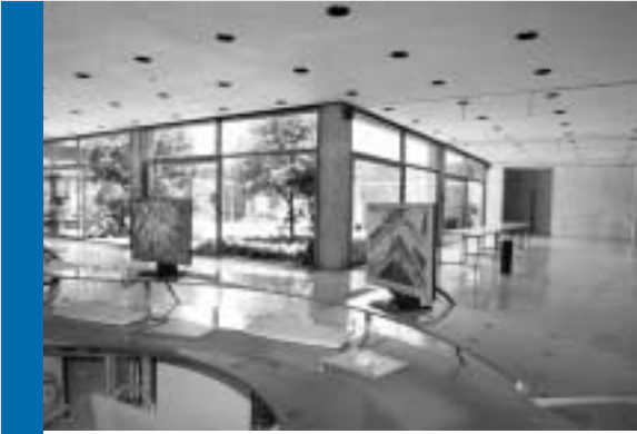
Άποψη του ισόγειου χώρου του ΕΙΕ όπου παρέχεται δωρεάν ασύρματη ευρυζωνική πρόσβαση στο Διαδίκτυο.

συνέδρια διεθνούς κύρους, κατατίθενται διπλώματα ευρεσιτεχνίας και ιδρύονται spin-off εταιρείες για την παραγωγή και προώθηση νέων τεχνολογιών. Παράλληλα εκπροσωπεί την Ελλάδα στο European Science Foundation, καθώς και άλλες διεθνείς επιστημονικές εταιρείες.