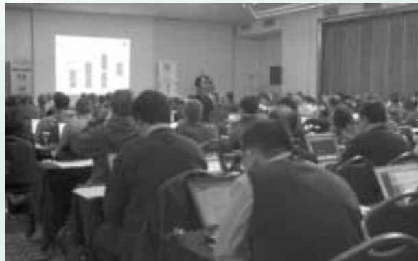
Στιγμιότυπο από την 16η Παγκόσμια Συνάντηση Global Grid Forum

Κύριος ομιλητής ήταν, μεταξύ άλλων, ο εφευρέτης των τεχνολογιών πλέγματος καθ. Ian Foster, ο οποίος παρουσίασε τις