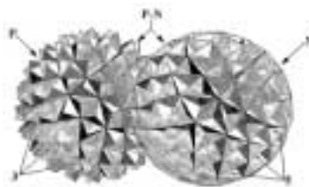
Σφαιρικά γρανάζια τρισδιάστατης μετάδοσης κίνησης

Ένα επιπλέον καινοτόμο χαρακτηριστικό στη σχεδιάσή τους είναι ότι, παρόλο που αυτή στηρίζεται σε πολυεδρικές επιφάνειες, ξεπερνά το "φυσικό φραγμό" κατασκευής κανονικού πολυέδρου που διαθέτει το πολύ 20 έδρες. Έτσι, τα σφαιρικά διαφοροποιούνται από τα παραδοσιακά γρανάζια, στα οποία η μετάδοση κίνησης είναι πάντα μονοδιάστατη ανά γρανάζι, και μπο-