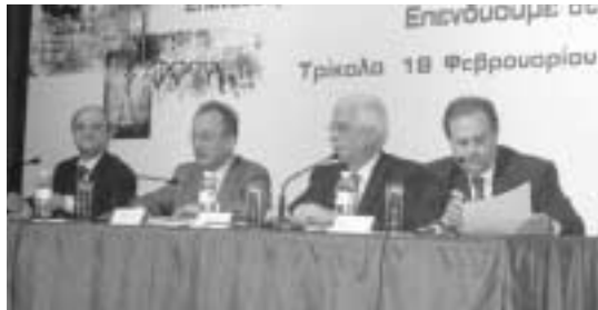
Στιγμιότυπο από την εκδήλωση στα Τρίκαλα, όπου ο υπουργός Ανάπτυξης Δ. Σιούφας ανακοίνωσε την ίδρυση του ΚΕΤΕΑΘ

Το Ινστιτούτο Βιοϊατρικής Έρευνας και Τεχνολογίας (ΙΒΕΤ) δραστηριοποιείται σε τομείς ιατρικών εφαρμογών και βασικής