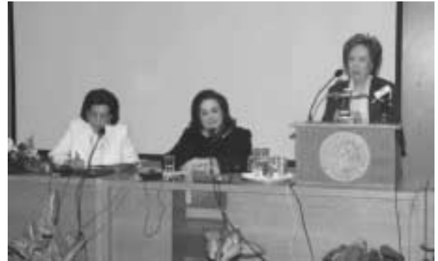
Από αριστερά: Ευγενία Κεφαλληνάου, Ειδική Γραμματέας ΥΠΕΠΘ, Μαριέττα Γιαννάκου, Υπουργός Παιδείας, Α. Ψαρούδα-Μπενάκη, Πρόεδρος της Βουλής

Η Υπουργός Παιδείας Μαριέττα Γιαννάκου υπογράμμισε πως τα Αρχαία και οι Βιβλιοθήκες αποτελούν το θεματοφύλακα της