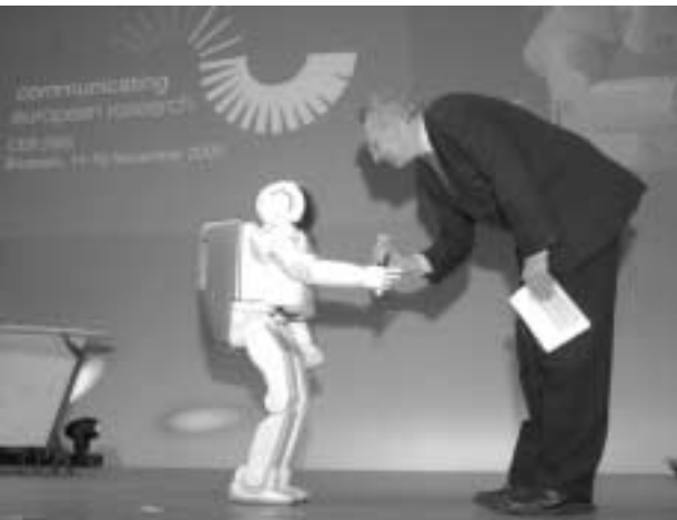
Ο ASIMO χαιρετάει τον Ph. Busquin