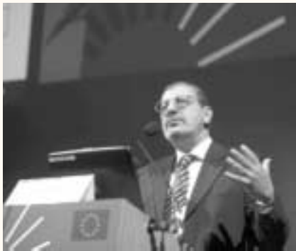
Ο απερχόμενος Γενικός Διευθυντής της Γ.Δ. Έρευνας Αχιλλέας Μητσός

Ο Γενικός Διευθυντής υπογράμμισε ότι η έρευνα αποτελεί πλέον ένα από τα κύρια θέματα της πολιτικής ατζέντας, μία από τις τρεις βασικές συνιστώσες - μαζί με την εκπαίδευση και την καινοτομία - στην πορεία προς την Κοινωνία της Γνώσης. "Η δαπάνη ενός ευρώ για την έρευνα, σε ευρωπαϊκό επίπεδο, ανταποδίδει μακροχρόνια 4-7 ευρώ. Επίσης η έρευνα μπορεί να συμβάλει στη μείωση του εμπορικού ρίσκου και δίνει ώθηση στην καινοτομία, ειδικά στις μικρομεσαίες επιχειρήσεις" δήλωσε χαρακτηριστικά. Παράλληλα, επισήμανε τη δημιουργία του Ευρωπαϊκού Συμβουλίου Έρευνας ως καθοριστική εξέλιξη της υποστήριξης της έρευνας στην ΕΕ.