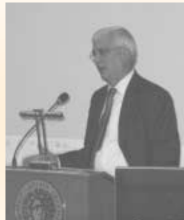
Ο Γενικός Γραμματέας Έρευνας και Τεχνολογίας καθ. Ι. Τσουκαλάς στην εκδήλωση παρουσίασης του Κόμβου του ΕΚΚΕ

Στην ομιλία του, ο κ. Ιωάννης Υφαντόπουλος, Διευθυντής του ΕΚΚΕ, υπογράμμισε πως ο Κόμβος είναι ένα από τα μεγαλύτερα και σημαντικότερα ερευνητικά έργα του ΕΚΚΕ και, ως υποσύστημα της Ελληνικής Τράπεζας Κοινωνικών Δεδομένων, εντάσσεται ήδη στο