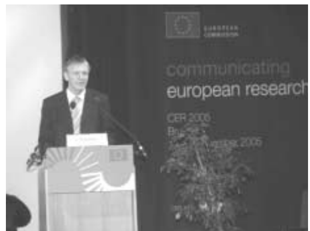
Ο Ευρωπαίος Επίτροπος για την Έρευνα Janez Potocnik

Από την πλευρά της, η Επιτροπή στοχεύει να αναδείξει στο μέγιστο βαθμό το ρόλο της έρευνας και της τεχνολογίας στην ανάπτυξη της κοινωνίας. "Επτά στους δέκα Ευρωπαίους πολίτες έχουν ως κύρια πηγή πληροφόρησης την τηλεόραση. Πρέπει να κάνουμε καλύτερη χρήση αυτού του μέσου, και προς αυτή την κατεύθυνση επενδύουμε σε οπτικοακουστικές παραγωγές τις οποίες θα μπορούν να χρησιμοποιήσουν τα ΜΜΕ. Επίσης, ιδιαίτερη έμφαση θα δώσουμε και στο ραδιόφωνο" ανακοίνωσε ο J. Potocnik. ■